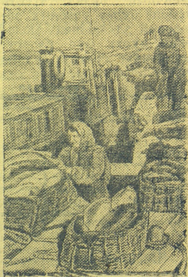
Весенняя путина на Дону (Сталинградская область). На снимке: рыбаки колхоза имени Игнатъева производят разгрузку рыбы, доставленной ими на Калачевский рыбозавод.

Рыба подошла. Ее не нужно было шупать длинным, гладко оструганным, тонким, какие только делают у поморов, шестом. Сельдь шла большим, плотным косяком, отливающим черными спинками на солнце. Один за другим с„езжают с берега разгребы. К месту лова спешат, разбросанные в поисках рыбы по губе, лодки рыбаков. Одна за другой погружаются в воду матицы, умелые руки выбрасывают крылья неводов. Разгребы раз„езжаются и через несколько минут снова с„езжаются.