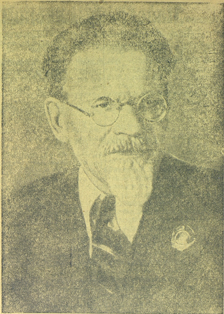
Михаил Иванович Калинин