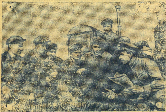
Новоторжская МТС одна из передовых в Калининской области. В этом сказалась большая работа, которую проводит партийная организация МТС.