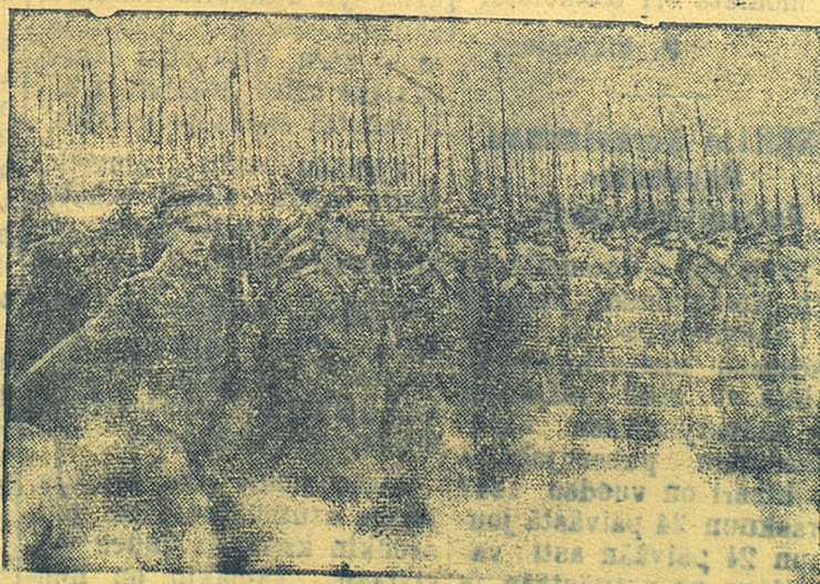
Lokakuun Suuren sosialistisen vallankumouksen 30-vuospäivän juhliminen Moskovassa. Moskovian varusväen sotajoukkojen paraati.

Valtava liike uusien työvoittojen puolesta on alkanut aikana, jolloin me valmistaudumme työtätekevien edustajain paikallisten Neuvostojen vaaleihin. Tehtävämme on ottaa paikallisten Neuvostojen vaalipäivä vastaan uusien työvoittoin, sellaisin saavutuksin kaikilla tuotannon aloilla, jotka turvaavat viisivuotissuunnitelman täyttämisen neljässä vuodessa.