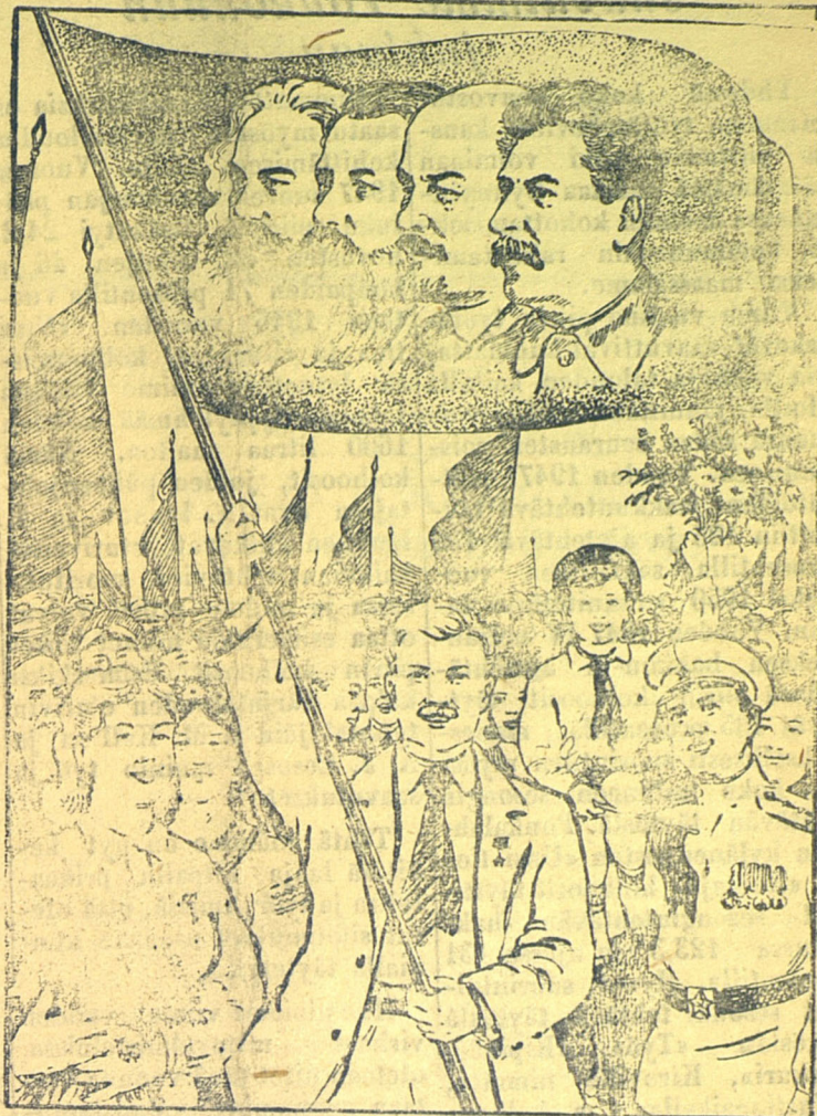
A. Morosovin piirros.