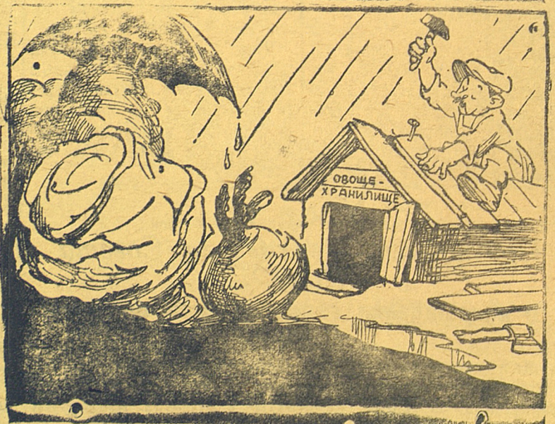
Скоро ли ремонт закончат?! Рисунок Ю. Узбякова Прессклише ТАСС