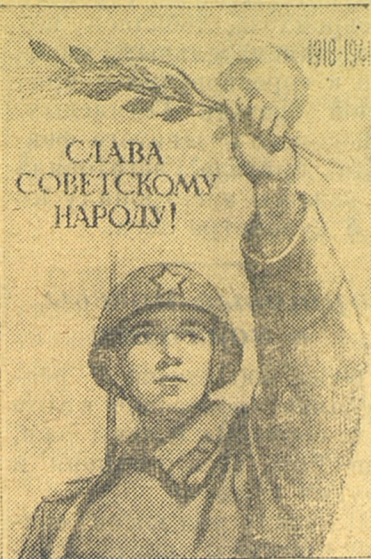
Плакат работы художника В. Иванова, "выпущенный издательством "Искусство".

Использование механизмов на полную мощь позволит Заонежскому леспромхозу успешно справиться с сезонным планом 1947-1948 года.