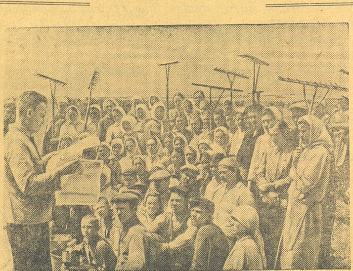
Кировоградская область. Хорошо поставлена агитационно- массовая работа на полевых станах в колхозе имени Орджони- кидзе, Бобринецкого района.

Одновременно мы обра- щаемся к директорам этих школ, чтобы они своевре- менно обеспечивали нас необходимым строительным материалом.