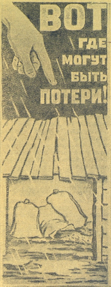
Берегите зерно от дождя и непогоды! (Издательство „Искусство“).