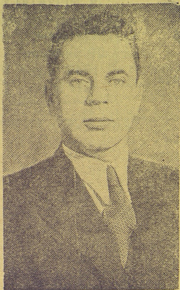
Н. А. Михайлов — секретарь ЦК ВЛКСМ.