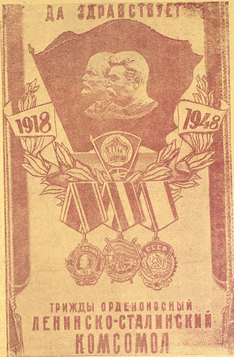
Плакат работы худ. И. Ганфа, выпущенный издательством „Искусство“.

Да здравствует Ленинско-Сталинский комсомол—верный помощник и резерв коммунистической партии! Да здравствует советская молодежь!