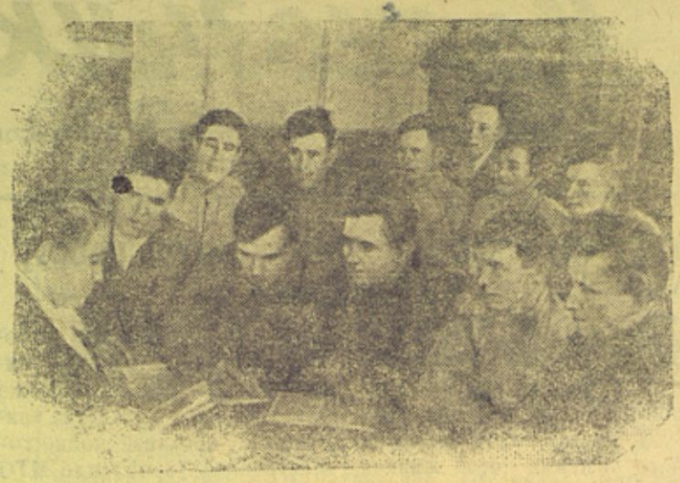
При Кулешовской МТС Утевского района, Куйбышевской области работает партийная школа, в которой занимаются коммунисты из трех партийных организаций.

8. Установить, что представление к присвоению звания Героя Социалистического Труда и награждению орденами и медалями СССР в соответствии с настоящим Указом производится по колхозам и МТС Министерством сельского хозяйства СССР, а по совхозам — Министерством совхозов СССР на основании проверенных государственным инспектором по определению урожайности материалов исполнительных комитетов областных и краевых Советов депутатов трудящихся, Советов Министров союзных и автономных республик по итогам каждого сельскохозяйственного года.