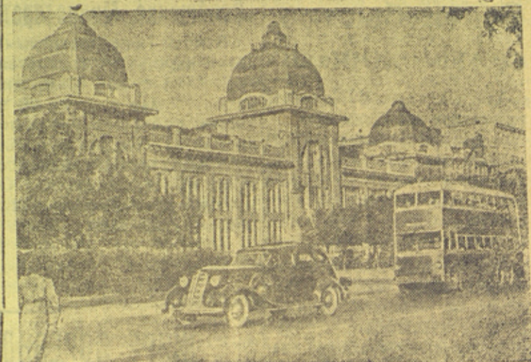
Москва — столица Советского Союза.

Во исполнение Указа Президиума Верховного Совета СССР от 2 сентября 1945 года об объявлении Дня Победы над Японией — 3 сентября нерабочим днем, Президиум Верховного Совета СССР постановил считать день 3 сентября праздником Победы над Японией — рабочим днем.