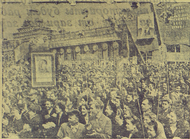
ПРАЗДНОВАНИЕ ПЕРВОГО МАЯ 1947 ГОДА В МОСКВЕ

Демонстрация трудящихся на Красной площади.