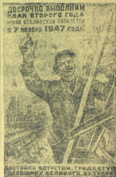
Плакат работы художника П. Кривоногова, выпущенный издательством „Искусство“.