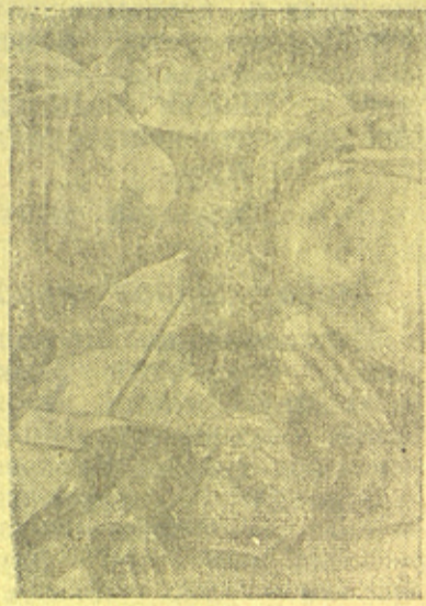
Зверства немцев в г. Осипенко (Бердянске).

В деревне Низово, Шелтозерского района, все 26 школьников были избиты резаками до потери сознания. Избивает сам директор школы, который заставляет каждого ученика приносить для своего избивания розги.