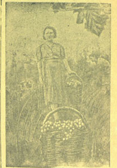
На снимке: уборка винограда на участке совхоза.