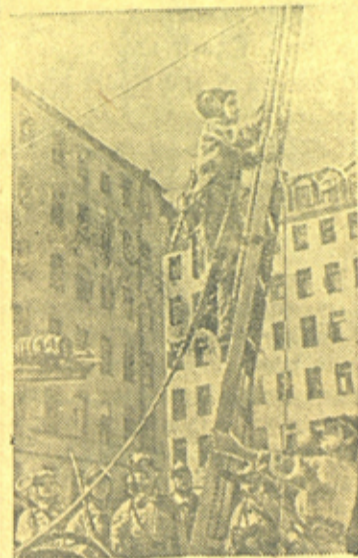
Женщины-пожарники одной из участковых пожарных команд Ленинского р-на (Ленинград) на тренировке.

В ноябре месяце бригада Гуртового обязуется увеличить производительность труда на заготовке леса до 7 ф/м. на каждого лесоруба.