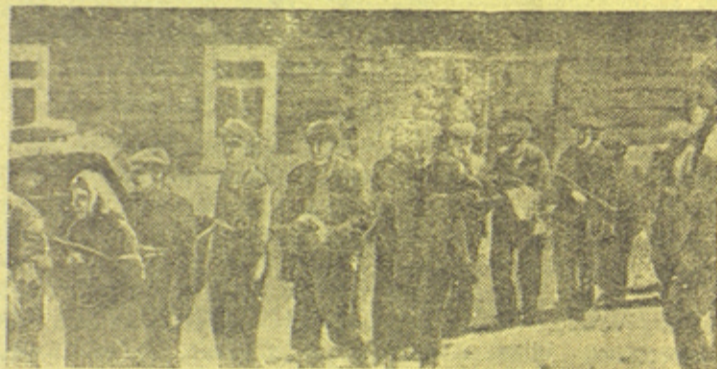
Ни в чем неповинных мирных советских людей немецкие изверги связывают веревками и гонят, как скот, на убой. (Снимок найден у убитого немецкого солдата).