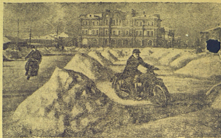
Мотоциклисты Архангельского мото-клуба на тренировке.