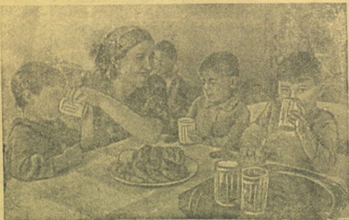
На снимке: в освобожденном от гитлеровцев г. Стариче (Калининская область). Дети фронтовиков в своем детском саду за завтраком.

Почин федякинцев широко подхвачен всей страной.