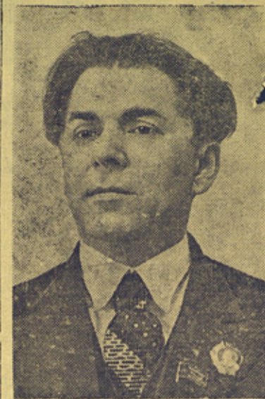
Украинский поэт-орденоносец, депутат Верховного Совета УССР Павло Тычина.

К 50-летию со дня рождения украинского поэта Павло Тычина (15 января 1941 года).