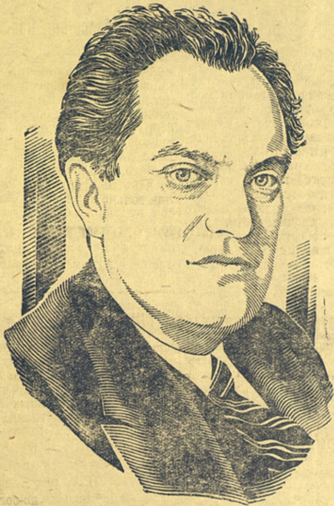
В. В. Куйбышев.

Тов. Куйбышев был верным соратником и учеником великого Сталина. Свою последнюю речь он закончил следующими словами: