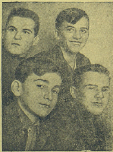
Комсомольцы ремесленного училища № 2 Кировского завода (Ленинград).