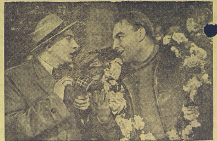
Момент встречи В. Чкалова на американском аэродроме. Репортер американской радиоконстанции (артист Г. Клеринг) берет интервью у В. Чкалова (артист В. Белокуров).