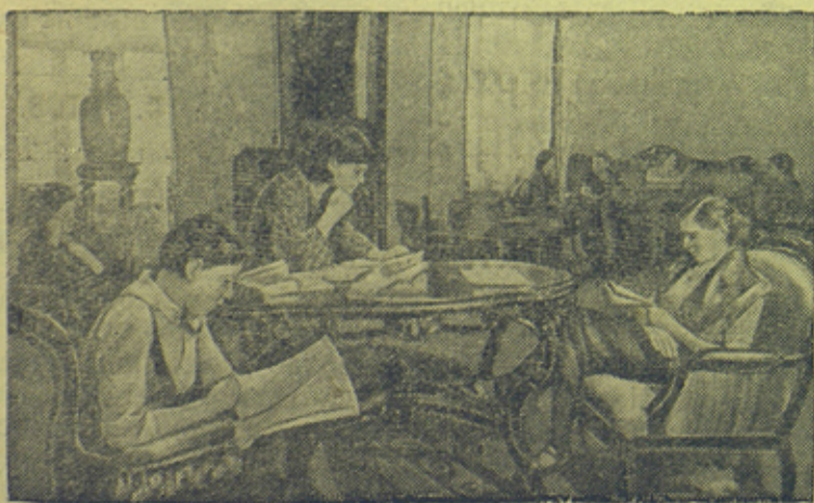
В гостиной Дома отдыха матери и ребенка на Кировских островах (Ленинград).