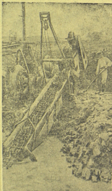
На Невьянской мовлой гидроустанове треста „Гидромеханизация“ золотосодержащие пески из разреза убираются замлесом.