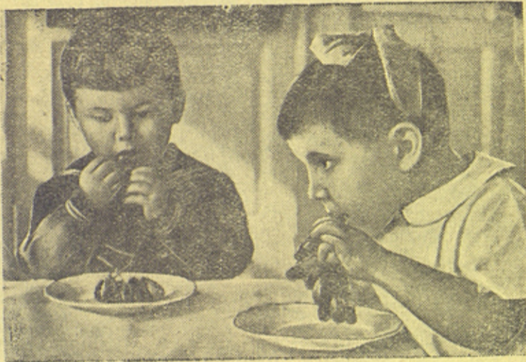
В детских яслях Кузнецкого металлургического комбината имени Сталина (гор. Сталинец)

Дети хорошо разучили песенки „Письмо Ворошилову“, „Письмо пограничнику“. С большим увлечением проходит игра „Миша и зайчик“.