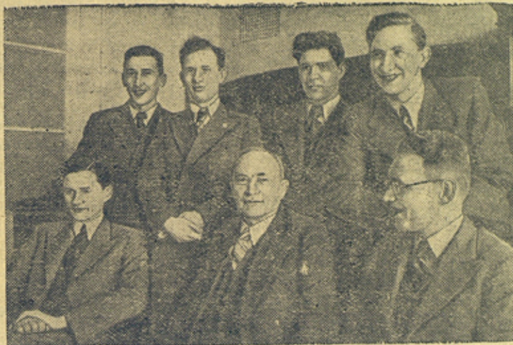
Тов. Куусинен среди участников турнира (слева направо); в первом ряду—П. Керес, О. Куусинен, М. Ботвинник; во втором ряду—И. Бондаревский, И. Болеславский, А. Лилиенталь и В. Смыслов.

6-го апреля шахматный турнир в Ленинграде посетил Заместитель Председателя Президиума Верховного Совета СССР и Председатель Президиума Верховного Совета Карело-Финской ССР товарищ О. Куусинен.