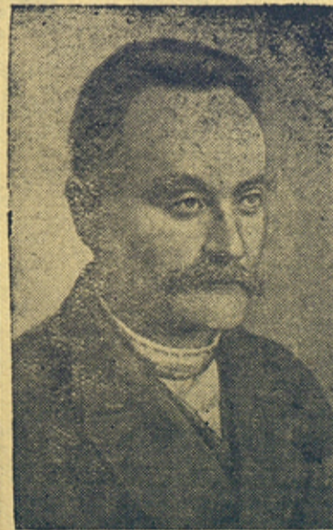
И. Я. Франко.

Коллектив комбината Иоханнес, обсудив обращение коллектива Камского бумажного комбината, включился в число соревнующихся на досрочное выполнение полугодовой программы.