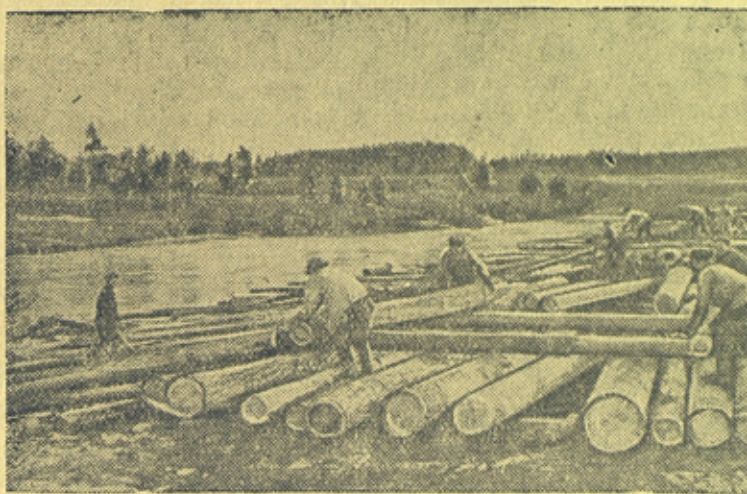
Отгрузка древесины на Билимбаевском сплавном участке.

Сплав леса по реке Чусовой (Свердловская область).