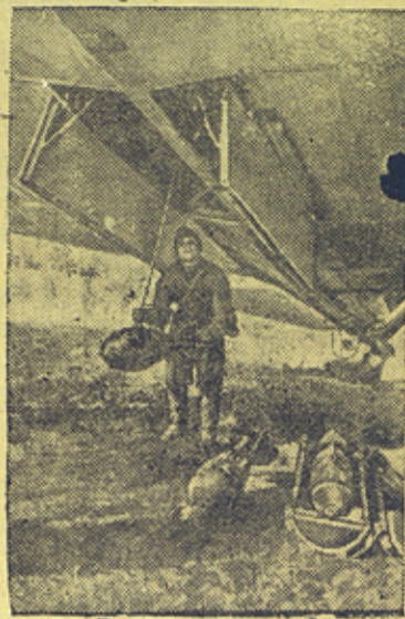
Перед боевым вылетом.