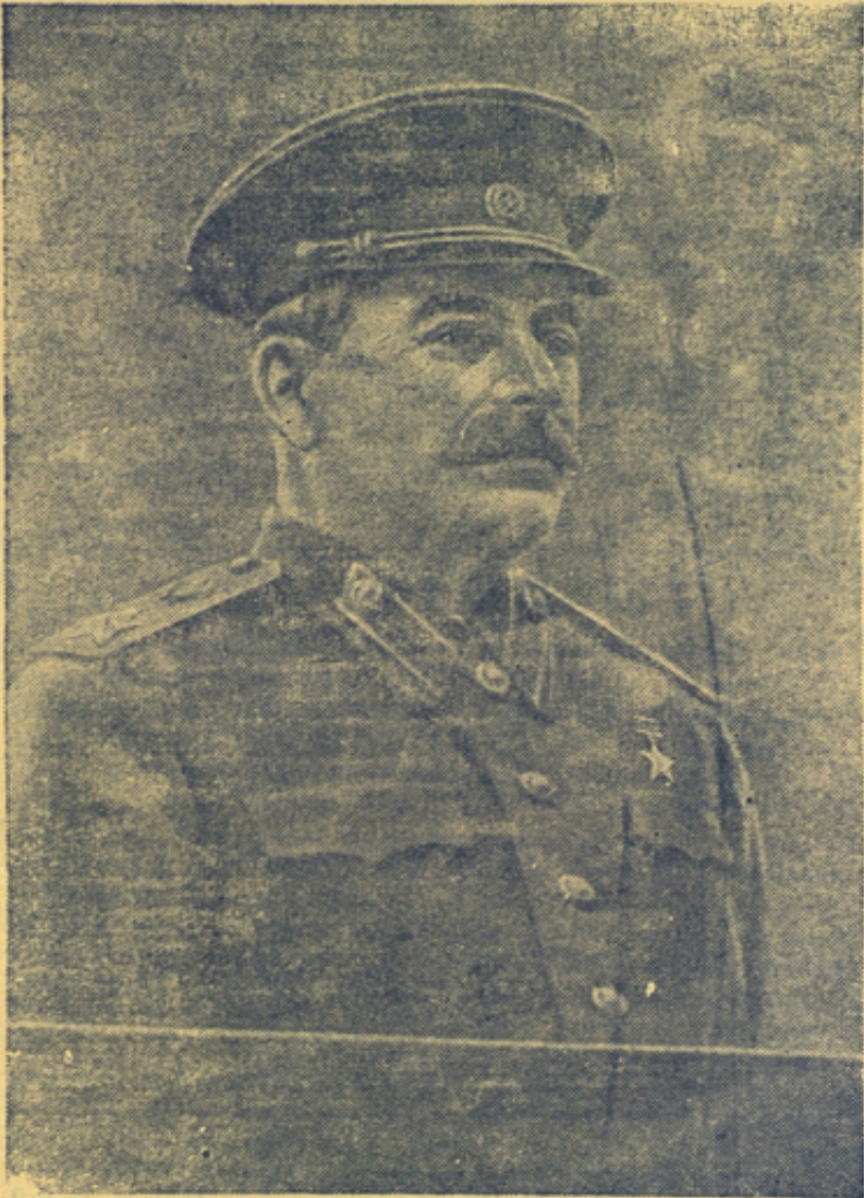
Председатель Совета Министров и Министр Вооруженных Сил Союза ССР Генералиссимус Советского Союза И. В. Сталин.

(На Призывы ЦК ВКП(б) к 29-й годовщине Великой Октябрьской Социалистической революции).