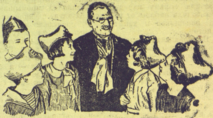
Английский профсоюзный деятель Том Манн с ребятами в доме пионеров и октябрят.