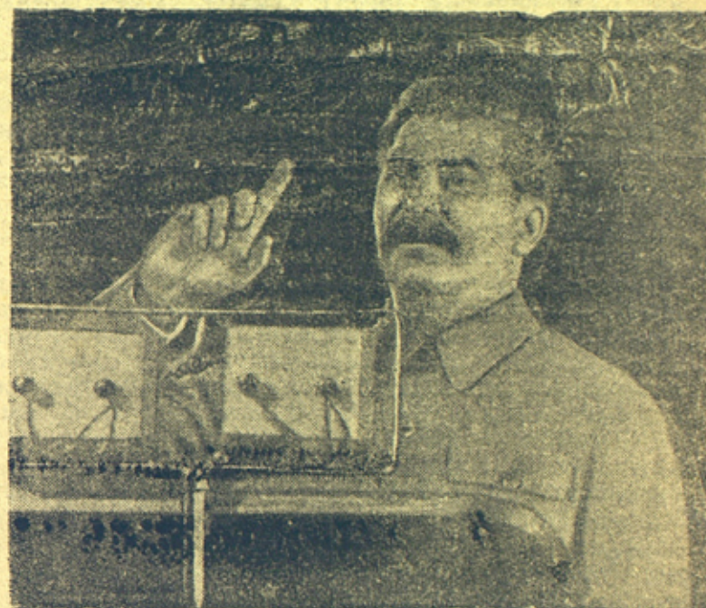
Выступление товарища И. В. Сталина на предвыборном собрании избирателей Сталинского избирательного округа гор. Москвы 11 декабря 1937 года в Большом театре.