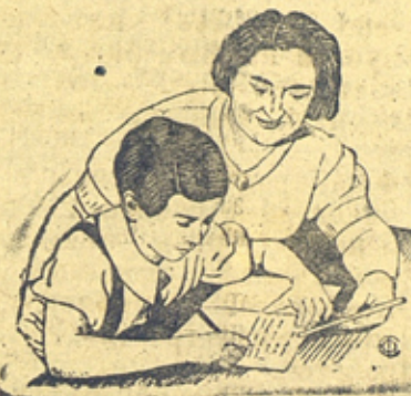
Рис. с фото Л. Доревского

Милягрос Де-ла Рекетте готовит урок по испанскому языку под наблюдением преподавательницы Ромендио Баргес.