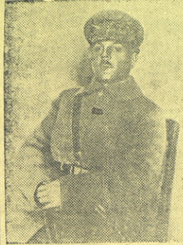
К. Е. Ворошилов в 1919—1920 гг. (Центральный музей В. И. Ленина)

Красная Армия есть армия освобожденных рабочих и крестьян. Эта армия под руководством партии Ленина—Сталина боролась в годы гражданской войны за то, чтобы освободить рабочих и крестьян от ига помещиков и капиталистов, боролась за утверждение диктатуры пролетариата. Эта армия, выросшая сейчас в могущественнейшую силу, стоит на страже завоеваний рабочих и крестьян. Малейшая попытка врагов отобрать эти завоевания разобьется