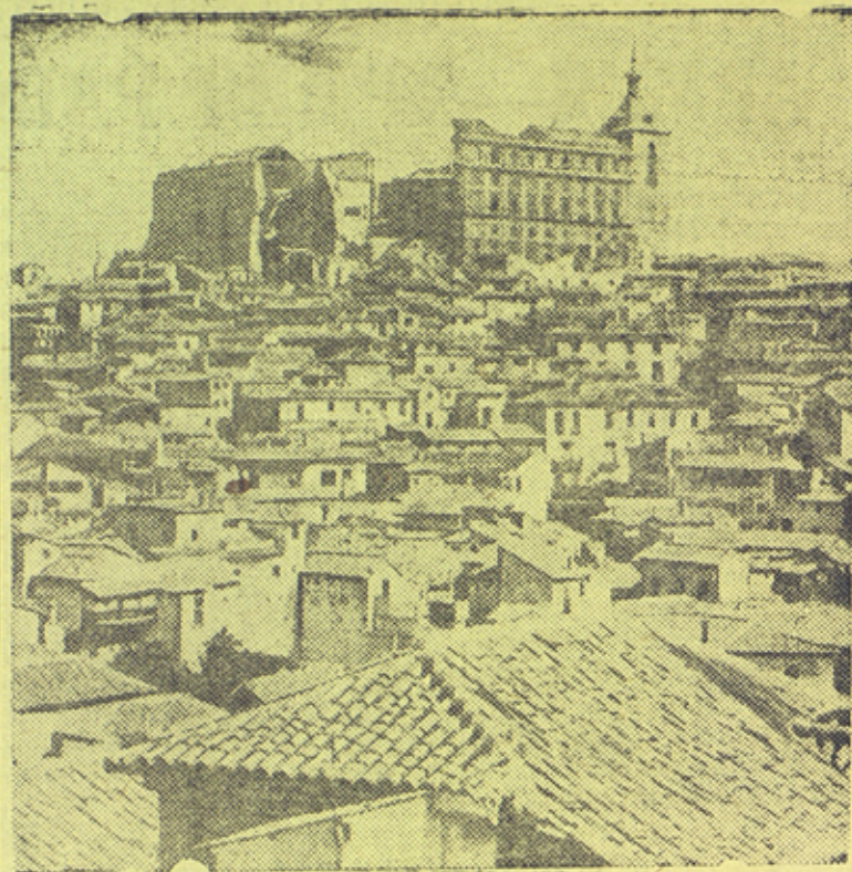
Город Теруэль (Испания) занятый республиканскими войсками.

В принятом решении по докладу райисполкома избиратели признали его работу неудовлетворительной и дали наказ, где особо выдвинуто требование решительной борьбы за разоблачение, выкорчевывание и ликвидацию вражеских элементов, ликвидацию последствий вредительства в советской работе и развертывание массовой политической работы среди трудящихся.