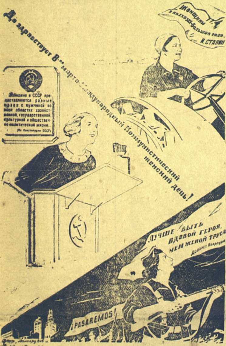
Рис. худ. Дени и Долгорукова

Орган Лоухского Райкома ВКП(б) и Райисполкома