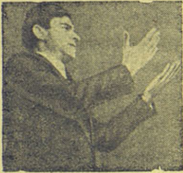
На снимке: Генеральный секретарь испанской коммунистической партии тов. Хосе Диас на трибуне.

В своем докладе тов. Хосе Диас указал, что народ, взявший собственную защиту в свои руки, не может быть побежден.