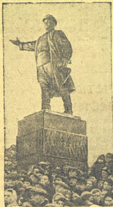
В декабре открыт памятник С. М. Кирову на Кировской площади в Ленинграде.