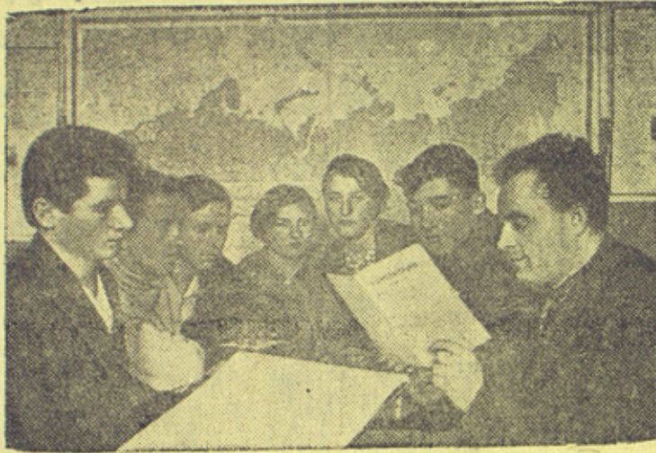
На снимке: занятие кружка по изучению Конституции РСФСР студентов 3-го курса Рославльской фельдшерской школы (Смоленской области).

Подготовка к выборам в Верховный Совет РСФСР