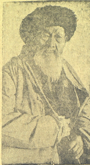
На снимке; Народный певец Казахстана Джамбул.