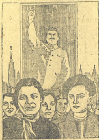
Плакат Изогиза работа художников М. Волковой и Н. Пинус. Рис. с репродукции Совафото. Пресканише.

Да здравствует равноправная женщина СССР, активная участница в управлении государством, хозяйственными и культурными делами страны!