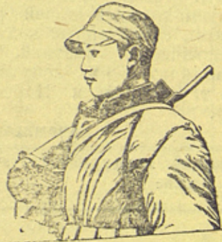
На снимке: Боец китайской армии.

Рисунок с фото Совэфото К военным действиям в Китае