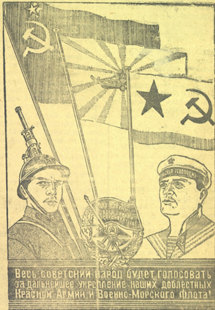
Плакат работы художника В. Стенберга, выпущенный Изогизом.