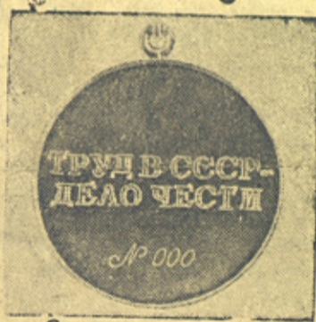
ОБОРОТНАЯ СТОРОНА.