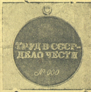
ОБОРОТНАЯ СТОРОНА. Репродукция Ф. Кислова. Бюро-клише ТАСС.