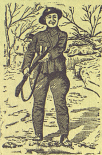
На рис: Китайская женщина, добровольно поступившая в армию.