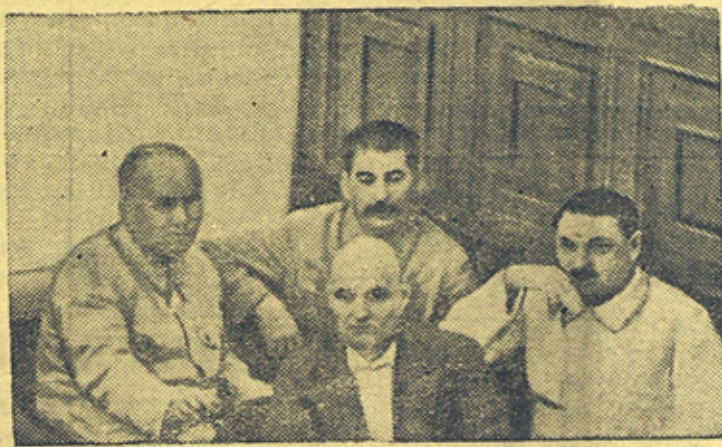
На снимке: Товарищи И. В. Сталин, А. А. Жданов, Н. С. Хрущев и В. Ф. Шкирятов в ложе Президиума Верховного Совета СССР.