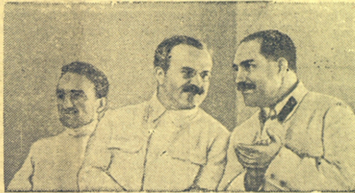
На снимке (слева направо): А. И. Микоян, В. М. Молотов и Л. М. Каганович в ложе Совнаркома на первом заседании сессии.