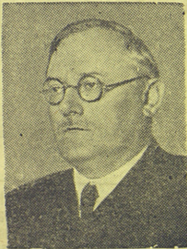
Депутат А. Я. Вышинский, назначенный на первой Сессии Верховного Совета прокурором СССР.