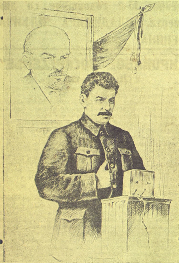
И. В. Сталин выступает на II Съезде Советов.