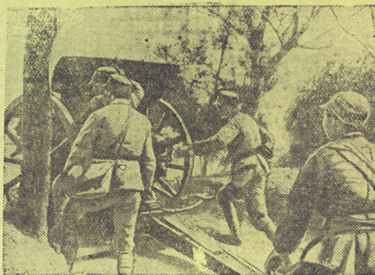
На сн.: Китайская артиллерия на позиции.