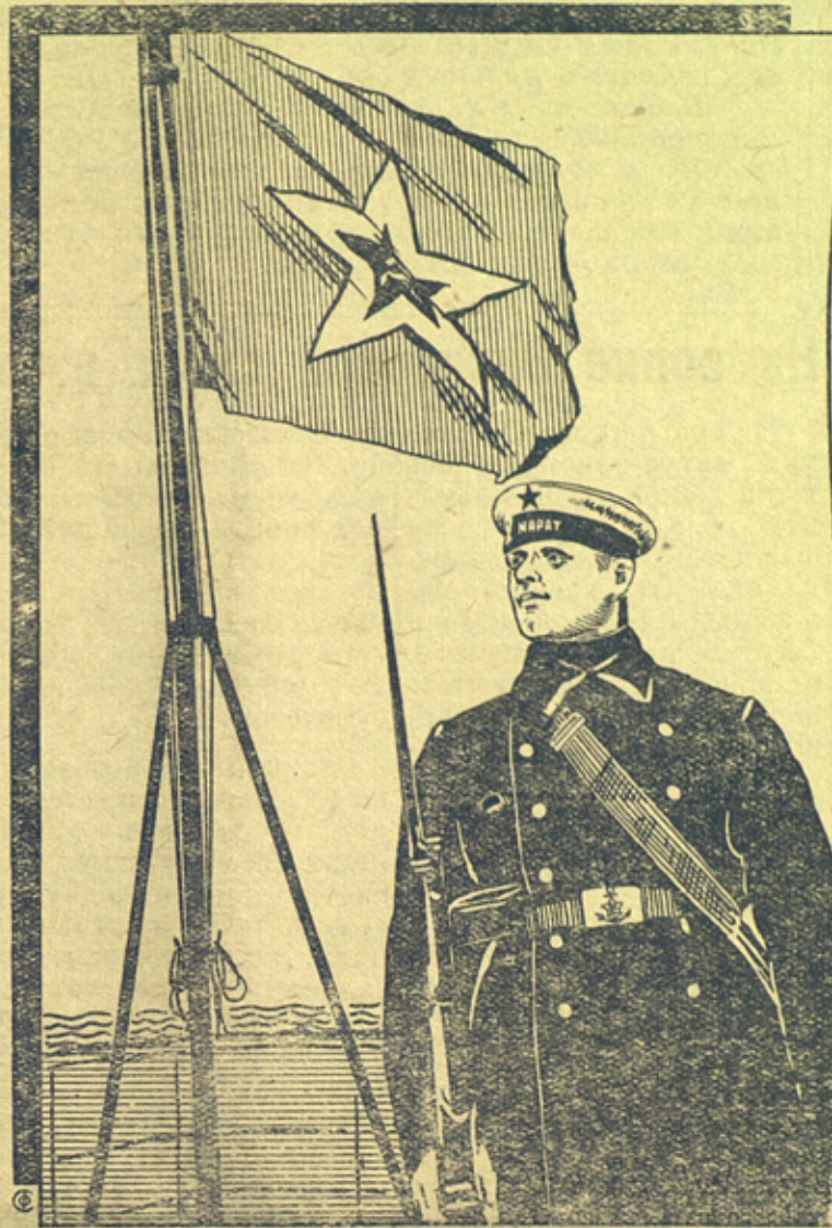
Краснознаменный Балтийский флот. На вахте.

В любую минуту, по первому зову нашей партии и Советского Правительства железной стеной поднимется непобедимая армия трудового народа на защиту социалистической родины.