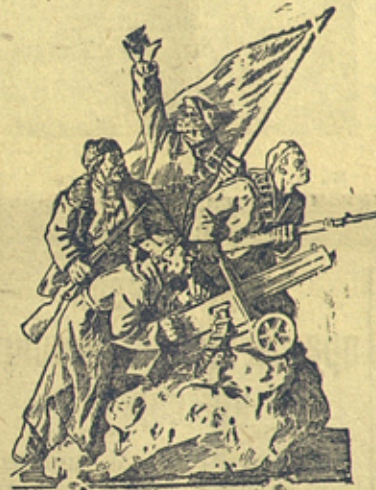
Рис. с фото В. Лисицина

Скульптура „Вперед, гражданская война“. (Работы скульптора В. Буринова.)