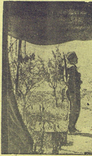
На сн.: Часовой на посту (зона реки Эбро).