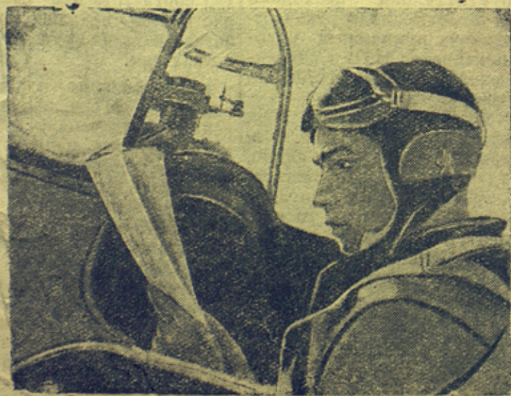
На снимке: Молодой летчик республиканской Испании перед полетом.