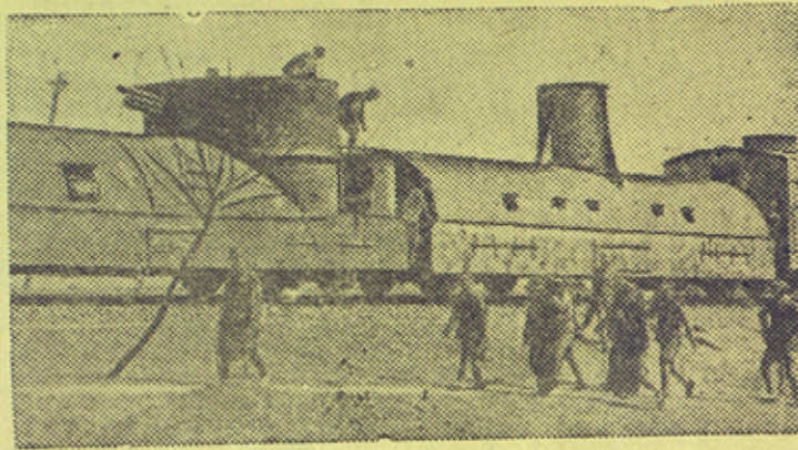
На сн: Бронепоезд китайской армии на фронте.