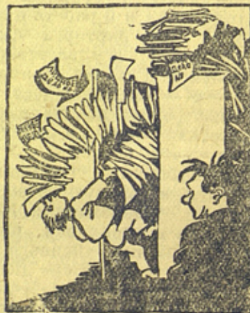
Рис. Анфилова Б. („Пресеклише“)

У нас, знаете, образцовый порядок, сейчас откромю шкаф и быстро найду ваше дело.