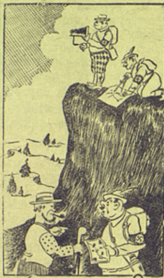
Рис. М. Огарова („Прессклише“)

— У Вас, в Финляндии сильно пересеченная местность, трудно пройти!