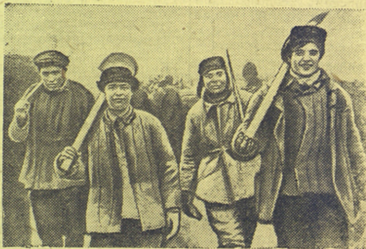
Комсомольская бригада бетонщиков на Днепрострое