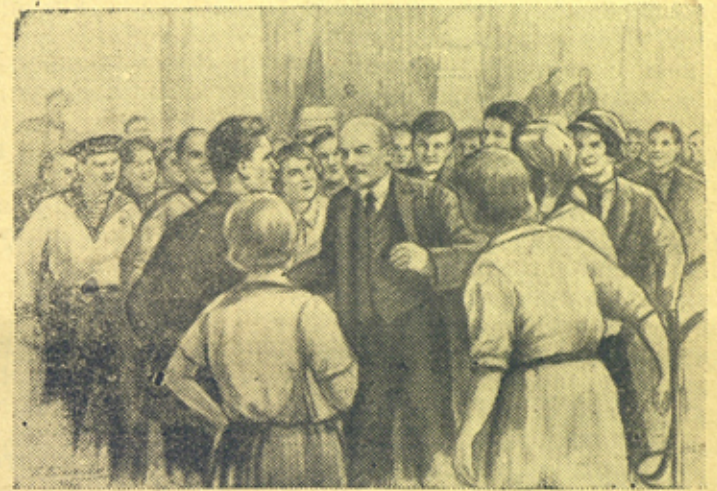
В. И. Ленин среди делегатов III съезда комсомола 1920 г.